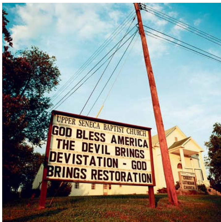
La Convention baptiste du Sud offre une aide gratuite à ses membres coupables de viol. Les victimes n'ont droit à rien.

La crise qui secoue l'Église catholique après des décennies d'abus sexuels dans ses rangs a masqué une histoire similaire, mais beaucoup moins médiatisée : le refus, par la plus importante Église protestante américaine, la Convention baptiste du Sud (CBS) (1), de créer une base de données sur ses pasteurs convaincus d'actes pédophiles ou accusés de façon crédible. Ce refus contribue à faire des 44 000 Églises de la CBS un « véritable paradis pour les prédateurs sexuels », explique Christa Brown, une avocate en vue d'Austin, au Texas. Les preuves accablantes qu'elle a savamment rassemblées dans le récit de son propre calvaire suggèrent que la distinction entre homme de Dieu et violeur a souvent, au sein de la CBS, l'épaisseur d'une feuille de papier à cigarette.